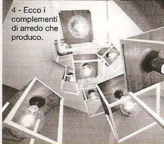
4 - Ecco i complementi di arredo che produco.